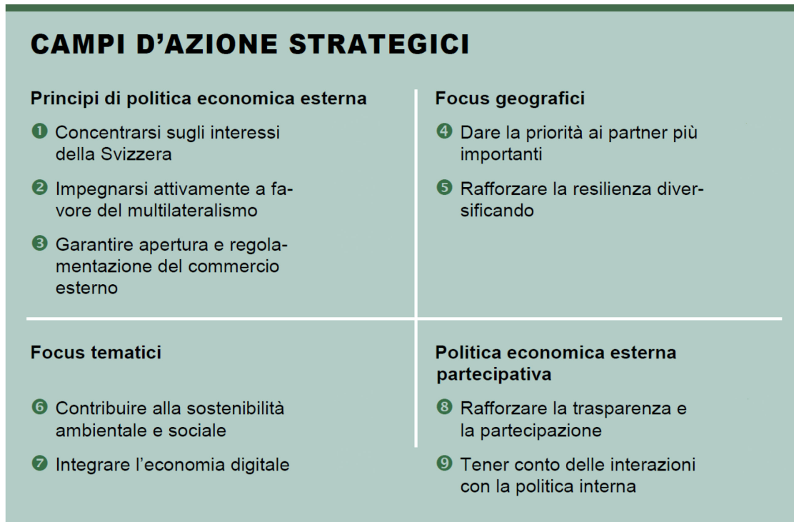
Figura 1: Campi d'azione della strategia di politica economica esterna 2021